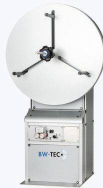
Rollhalterung mit Abrollmechanismus